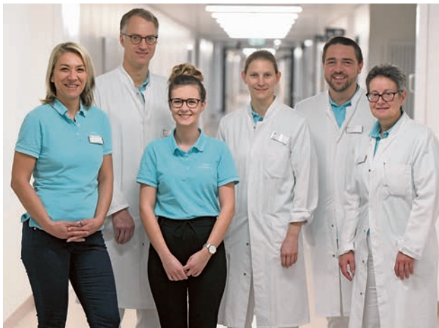
Das Team der Fuß- und Sprunggelenkchirurgie

Behandelt werden im Speziellen die folgenden Verletzungen bzw. Erkrankungen im Bereich der Fuß- und Sprunggelenkregion: